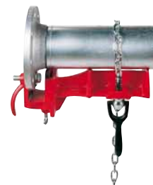
Svěřák pro svařování přírubových trubek