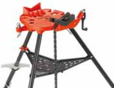
460-12 Přenosný řetězový svěřák TRISTAND