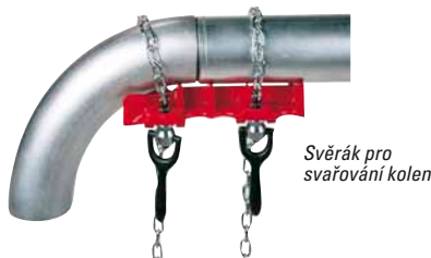
Svěřák pro svařování kolen