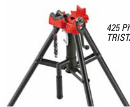
425 Přenosný řetězový svěřák TRISTAND