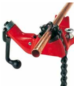
Stolní řetězový svěřák s horním šroubem