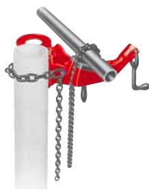
Řetězový svěřák na sloupek s horním šroubem