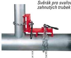
Svěřák pro svařování zahnutých trubek