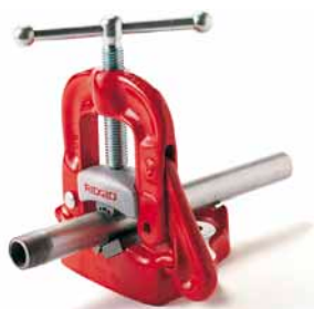
Stolní třmenový svěřák