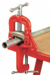
Přenosná souprava třmenového svěřáku