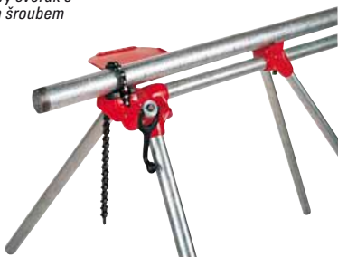
Stojanový řetězový svěřák s horním šroubem

** Dodává se pro modely 460-6, čelist pro plastové trubky, katalogové č. 41280. Objednává se samostatně.