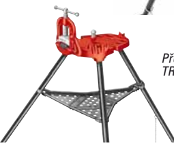
Přenosný třmenový svěřák TRISTAND 40-A